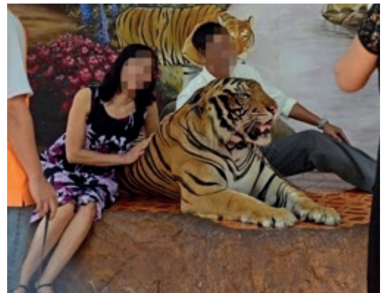
@World Animal Protection